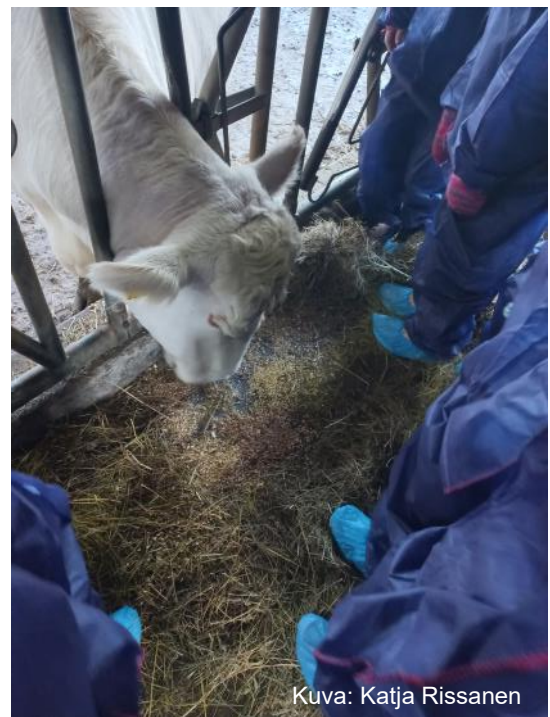
Kuva: Katja Rissanen

Liity mukaan ja tehdään yhdessä ympäristötämme parempi!