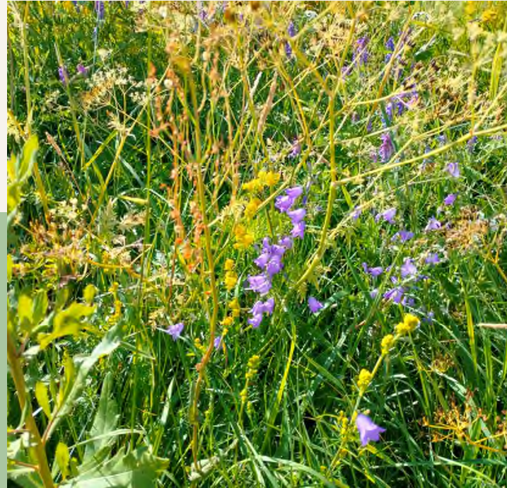
LAJIT Eliöyhteisöjen monimuotoisuus