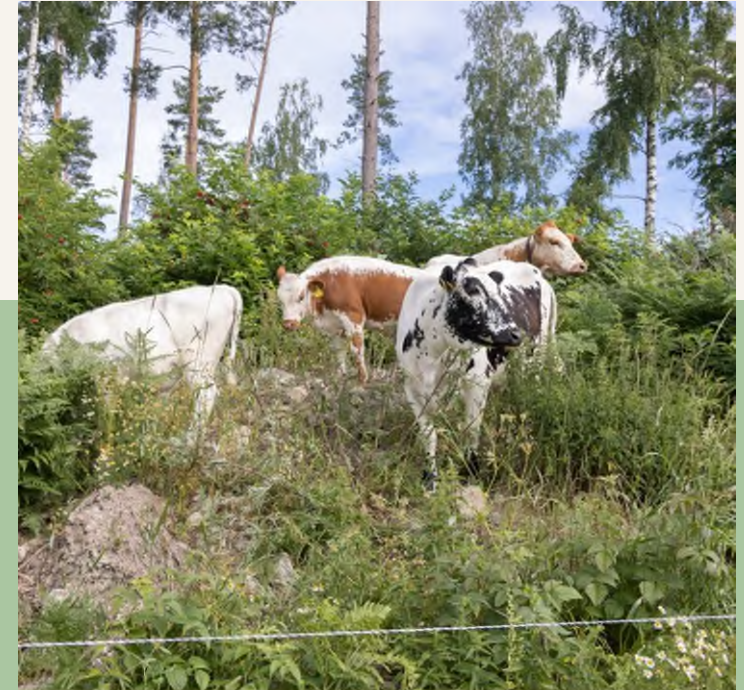
GEENIT Eliöiden perintötekijöiden erilaisuus