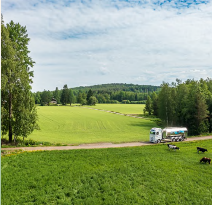
EKOSYSTEEMIT Elinympäristöjen vaihtelevuus