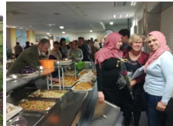
Kuvat: 4,5 & 6: Maahanmuuttajien kotouttamistoimenpiteistä.