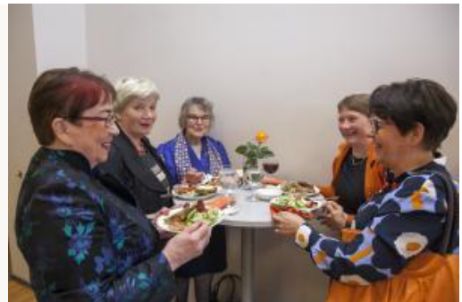
Kuvat 2 & 3: Omat avaimet Maa- ja kotitalousnaisten yhteistyön ja neuvonnan historiaa -teoksen julkistamistilaisuudesta.