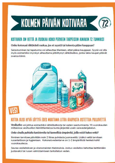
Kuva 14. Kolmen päivän kotivara -esite opastaa miten varautua häiriötilanteisiin kotitalouksissa.

Maa- ja kotitalousnaisten Keskuksella on edustus Huoltovarmuuskeskuksen asettamassa omatoimisen varautumisen järjestötoimikunnassa eli KOVA-toimikunnassa. KOVA-toimikunta tuottaa tietoa ja materiaalia kansalaisten omatoimisen varautumisen tueksi häiriötilanteissa. Viestinnässä ovat mukana toimikunnan jäsenjärjestöt. Maa- ja kotitalousnaiset ja Marttaliitto tuottivat yhdessä uusitun Kolmen päivän kotivara-aineiston KOVA-toimikunnan tilauksesta järjestöjen ja kansalaisten käyttöön.