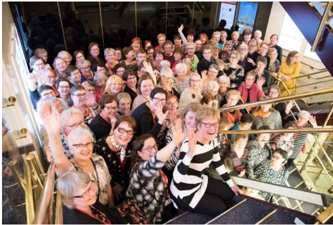
Kuva 12. Tiedon lisäksi puutarha-aiheinen opintomatka vahvisti yhteisöllisyyttä