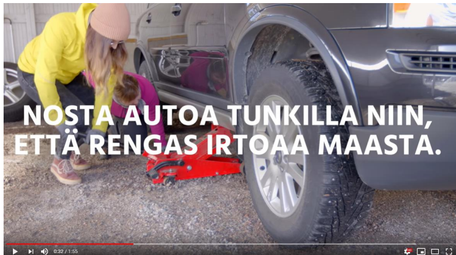
Kuva 27. Tehtävä Z-hankkeeseen tuotettiin renkaiden vaihto -video yhteistyössä Taitoliiton ja Marttaliiton kanssa.