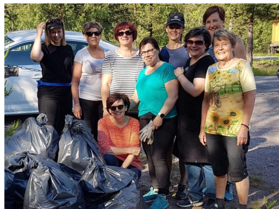
Kuvat 10.–11. Roskareippailuja Hämeenkyrössä ja Harjavallassa.