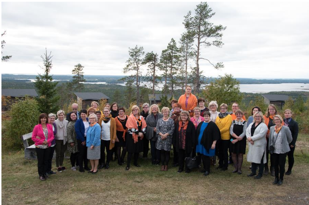
Kuva 2. Naiset maaseudun tulevaisuutta rakentamassa -seminaarin osallistajat.