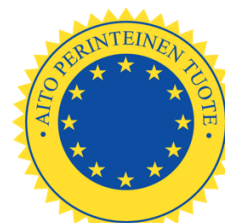
Aito perinteinen tuote (APT) Garanterad traditionell specialitet (GTS) Traditional Speciality Guaranteed (TSG)