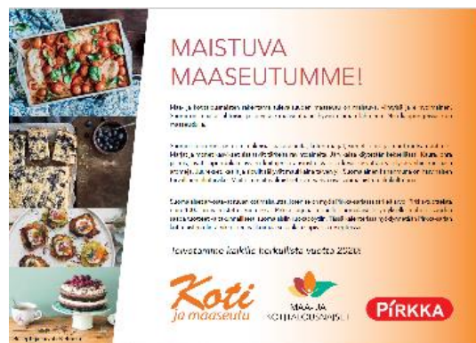
Kuva 1. Maa- ja kotitalousnaisten kalenteri 2020.

Toimintavuonna toteutettiin kalenteri vuodelle 2020 yhteistyössä K-ryhmän Pirkan kanssa. Maa- ja kotitalousnaisten osalta kalenteriin kirjattiin mm. ruoanvalmistukseen ja ravitsemukseen liittyviä vinkkejä, Koti ja maaseutu -lehden ilmeistymisajankohdat ja erilaisia tapahtumia. Kalentrista otettiin 4 000 kappaleen painos ja sitä toimitettiin piirikeskustoille sekä erillisryhmille mm. kaikille kansanedustajille.