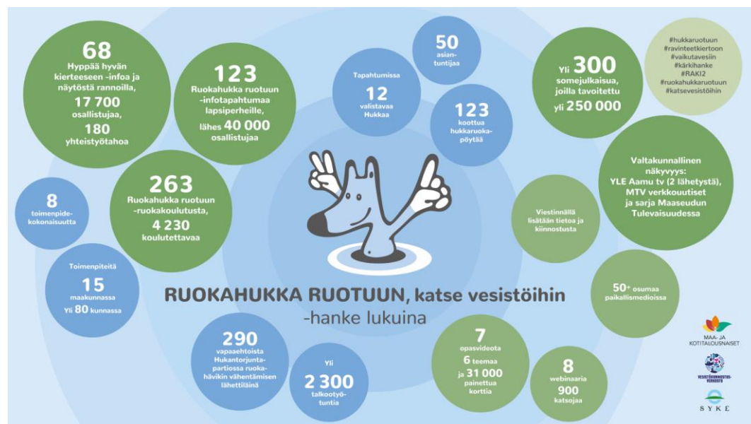
Kuva 6. Ruokahukka ruotuun, katse vesistöihin -hankkeen tulosten yhteenveto.

Valtakunnallinen hanke työ näkyi kattavasti käytännön tapahtumissa eri puolilla maata ja valtakunnallisissa sekä alueellisissa viestintäkanavissa. Hankkeen infotapahtumilla ja ruokakoulutuksilla tavoitettiin yhteensä yli 50 000 osallistujaa. Webinaarit tavoittivat 900 katsojaa. Viestinnällä muun muassa sosiaalisessa mediassa ja paikallisella, alueellisella sekä valtakunnallisella medianäkyvyydellä tavoitettiin miljoonia kontakteja. Vapaaehtoistyötä hankkeessa tehtiin yli 3 000 tuntia. Kuvassa 6. on esitetty yhteenveto hankkeen tuloksista. Rahoitus: ympäristöministeriö