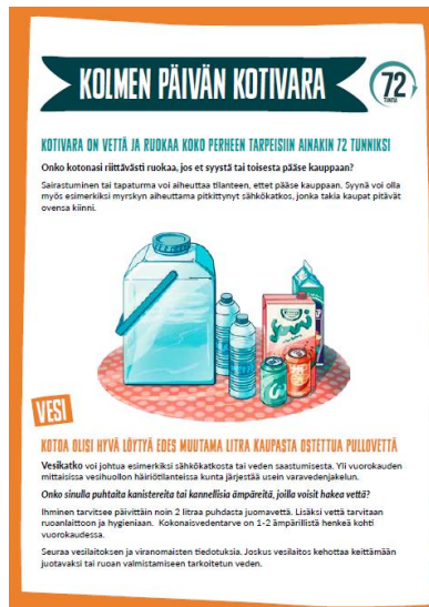
Kuva 14. Kolmen päivän kotivara -esite opastaa miten varautua häiriötilanteisiin kotitalouksissa.

Maa- ja kotitalousnaisten Keskuksella on edustus Huoltovarmuuskeskuksen asettamassa omatoimisen varautumisen järjestötoimikunnassa eli KOVA-toimikunnassa. KOVA-toimikunta tuottaa tietoa ja materiaalia kansalaisten omatoimisen varautumisen tueksi häiriötilanteissa. Viestinnässä ovat mukana toimikunnan jäsenjärjestöt. Maa- ja kotitalousnaisten ja Marttaliitto tuottivat yhdessä uusitun Kolmen päivän kotivara-aineiston KOVA-toimikunnan tilauksesta järjestöjen ja kansalaisten käyttöön.