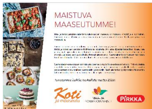
Kuva 1. Maa- ja kotitalousnaisten kalenteri 2020.

Toimintavuonna toteutettiin kalenteri vuodelle 2020 yhteistyössä K-ryhmän Pirkan kanssa. Maa- ja kotitalousnaisten osalta kalenteriin kirjattiin mm. ruoanvalmistuksen ja ravitsemukseen liittyviä vinkkejä, Koti ja maaseutu -lehden ilmentymisajankohdat ja erilaisia tapahtumia. Kalenterista otettiin 4 000 kappaleen painos ja sitä toimitettiin piirikeskuksille sekä erisid osryhmille mm. kaikille kansanedustajille.