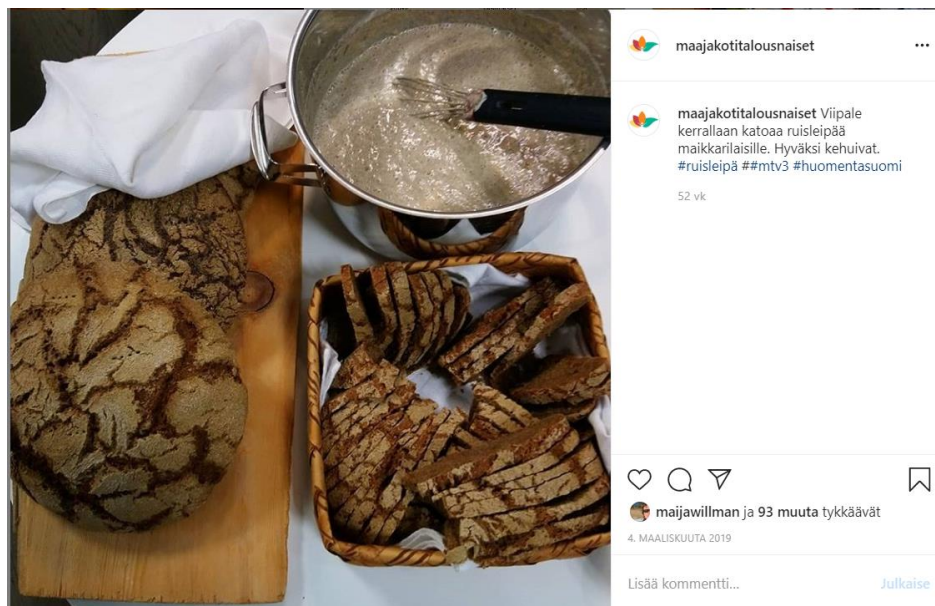
Kuva 23. Ruisleipä-julkaisu oli toimintavuonna Maa- ja kotitalousnaisten Instagram-tilin tykkätyin.

Maa- ja kotitalousnaisten Instagram-tilille julkaistiin toimintavuonna 148 julkaisua, jotka keskittyivät ruokaan, maise maan, maaseutuuyrittäjyyteen ja järjestön toimintaan/ihmisiin. Seuraajien määrä oli toimintavuoden aikana noussut lähes 1 500 seuraajaan. Eniten seuraajia on ikäryhmässä 35-44 vuotta ja parhaat maantieteelliset sijainnit ovat Helsinki, Oulu ja Jyväskylä. Tykkäysten määrä vaihteli muutamasta kymmeneistä lähes sataan. Tunnistella #maajakotitalousnaiset on tehty kaiken kaikkiaan yli 2 000 julkaisua ja tunnistella #MKNmaisema yli 1 100.