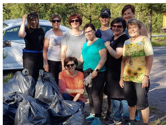
Kuvat 10.–11. Roskareippailuja Hämeenkyrössä ja Harjavallassa.