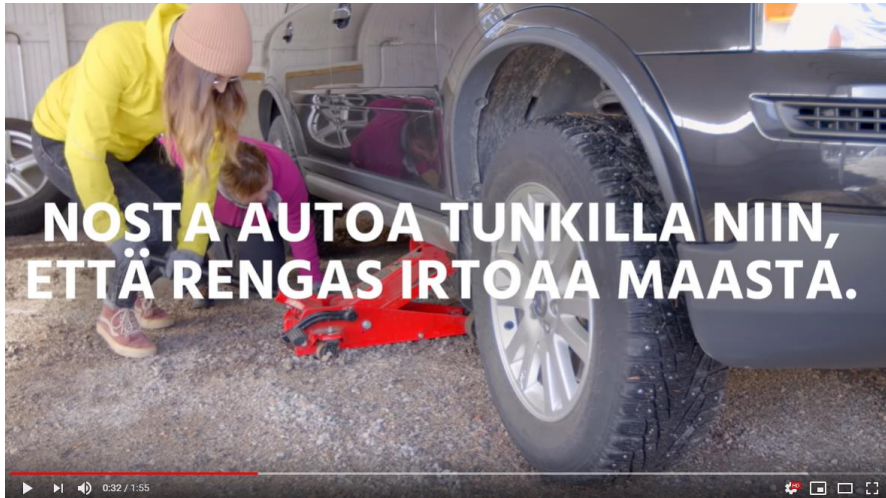
Kuva 26. Tehtävä Z-hankkeeseen tuotettiin renkaiden vaihto-video yhteistyössä Taitoliiton ja Marttaliiton kanssa.