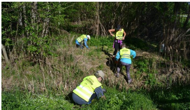
Kuva 8. Maa- ja kotitalousnaisten Keskus myönsi Vuoden 2019 maisemateko-tunnustuksen Lahden kaupungille. Lahden kaupunki on torjunut suunnitelmallisesti haitallisia vieraslajeja usean vuoden ajan hyvin laajalla alueella. Valintaraati arvosti erityisesti Lahden kaupungin kunnianhimoista tavoitetta hävittää kaikki torjuttavat vieraslajit kokonaan koko kaupungin alueelta. Lahdessa on myös tiedotettu ja koulutettu aiheesta esimerkillisen monipuolisesti