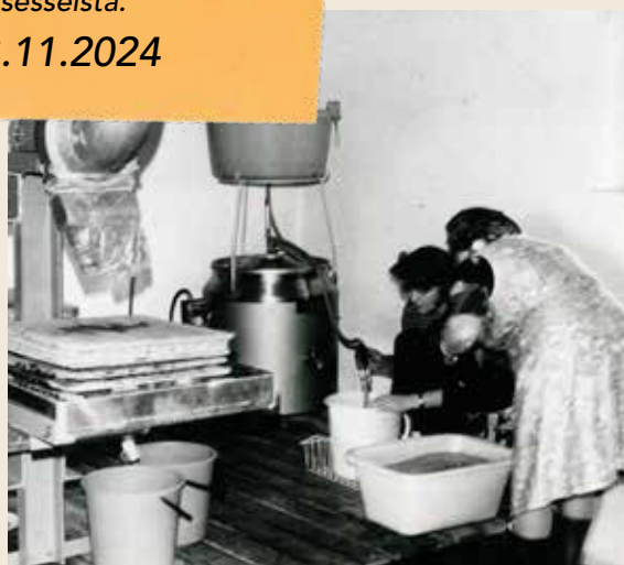
KUVAT OULUN JA KUOPION TYÖPAJOISTA, HELENA VELIN